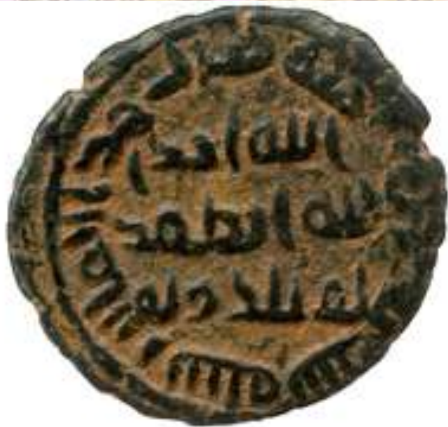
Uraysad, Fals, Balikh, undated. 2.80g (A 169; W 315); Fals, no mint. 1.6h, 3.95g (A 195; W 356). Gaez line. (2) (E10-50)

Wiles, R. & Curie, A. (1974) Journal of the Numismatic Society of Australia , 10, 1-4 http://www.numisbods.com.au/pap?paperid=1562&cat=34