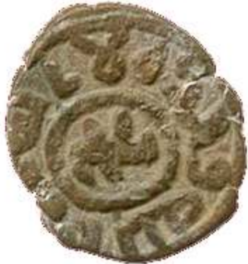
Utraxyed, Fa s. Balikt, undated. 3.80g (A 169, W 315); . Good fine. (2) (£40-50)

Wiles, D. & Currie, A. (1984) Journal of Numismatics , 11, 16-17 http://www.numisbids.co.uk/nr/paper.html?article=1502&id=1-1